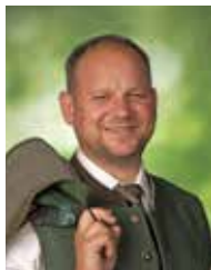
Mag. (FH) Michael Fröhlich Werbekonzept & -maßnahmen www.froehlichmarketing.at