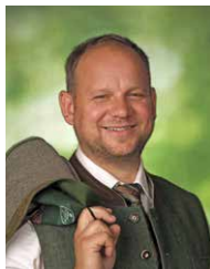
Mag. (FH) Michael Fröhlich Werbekonzept & -maßnahmen www.froehlichmarketing.at